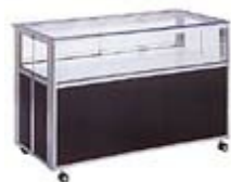
折りたたみケース